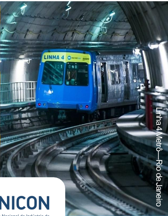
Linha 4 Metrô—Rio de Janeiro