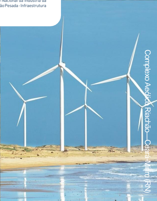
Complexo Aedica Riachão—Ceará-Nilim (RN)